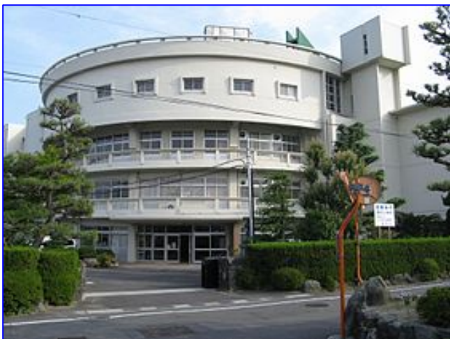
児童数の推移 平成14年～平成23年(4月1日現在)