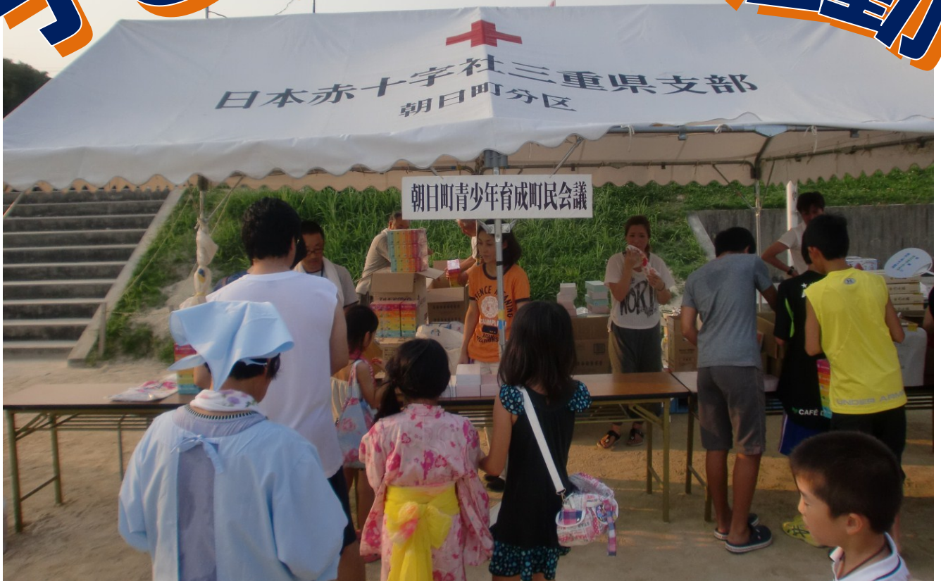
町民会議による抽選会・啓発活動の様子