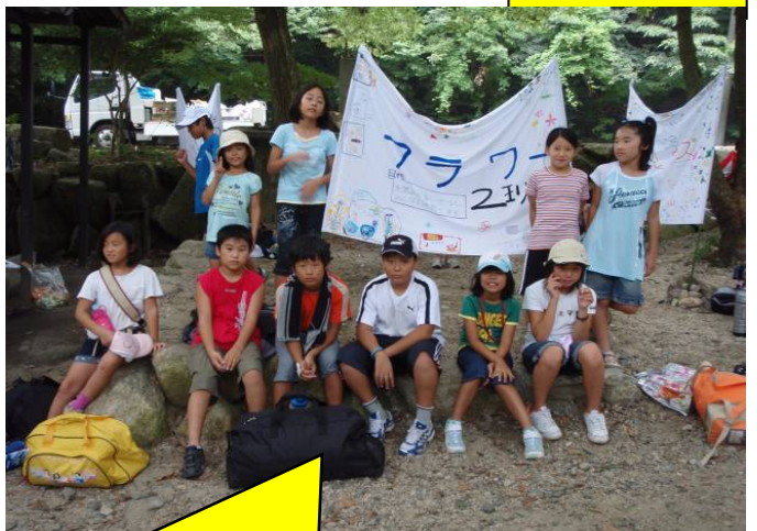
フラワー2班です！よろしく！