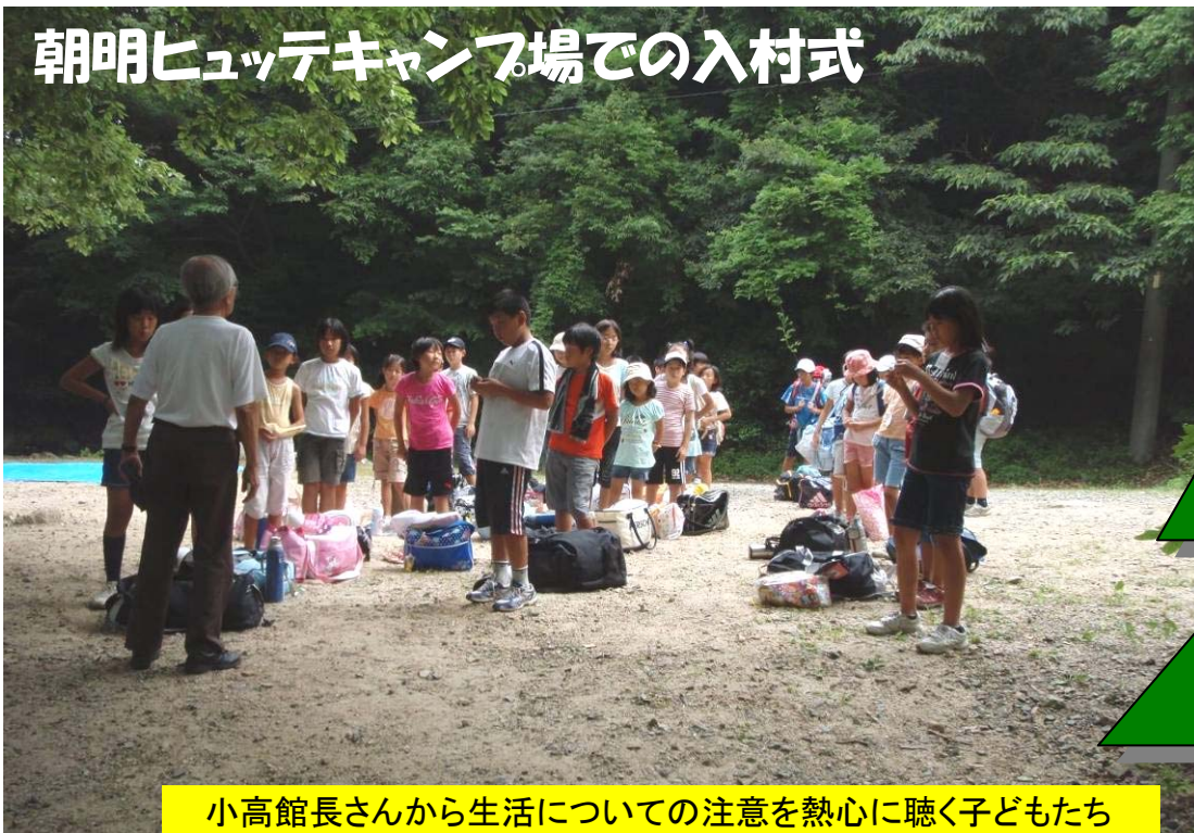
小高館長さんから生活についての注意を熱心に聴く子どもたち