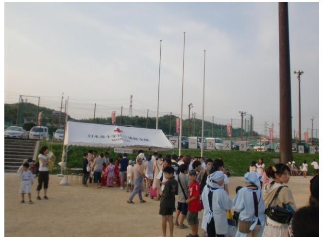
町民スポーツ施設にて開催