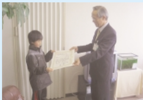
松阪市教育委員会教育長より表彰風景