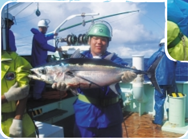
マリアナ諸島南東部にて、県立水産高等学校 実習船「しろちどり」でのカツオの一本釣り