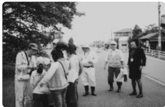
自然を学ぼう「東殿名（ひがしとのめ）地区」

日常生活で起こった些細なことを家族に伝える。そのことを家族共通の話題としてみんなで会話することで、家族みんなの気持ちや考え方を理解できるようになるのではないのでしょうか。そして、そのことを毎日毎日繰り返すことにより、家族の異変を誰かが敏感に察知しすぐに家族の話題として取り上げて話し合うことにより、異変の芽をすばやく摘み取ることができるのではないのでしょうか。これが「家族の絆」だと考えます。